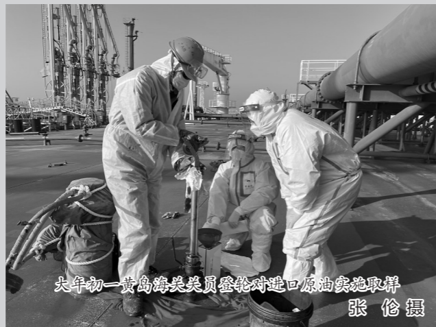
大年初一,青岛海关关员登轮对进口原油实施取样。

来自沙特阿拉伯,共计26万吨。为保证春节期间炼厂生产原料不断供,到港原油需要按计划卸货、转运。因此,海关检查取样、通关放行、卸货转运各环节必须无缝连接,哪怕一个小时都不能耽搁。”青岛实华原油码头有限公司相关负责人介绍说。