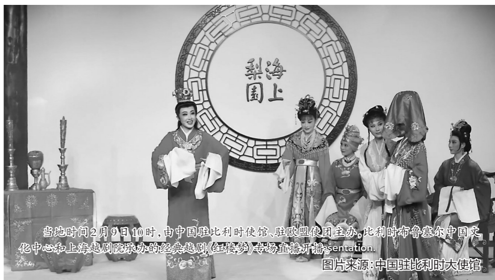
当地时间2月9日10时,由中国驻比利时使馆、驻欧盟使团主办,比利时布鲁塞尔中国文化中心和上海越剧院联合演出的经典越剧《红楼梦》专场直播开播。

在尼日利亚,2021年是中尼两国建交50周年,2月4日起,“欢乐春节”系列线上庆祝活动也在“云端”献上《过年》《寰宇同春》《听瓷语 观世界》《情景冰秀》《多彩中国年》等丰富多彩的文化大餐。同时,由两国高水平艺术团倾力打造的云端文艺演出也