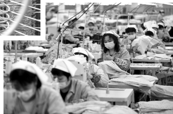
江苏泰州靖江市工业园区内钢铁加工配套企业生产、销售、外贸势头向好,车间工人们赶制订单产品一派繁忙。工人正在碳钢、不锈钢仓储吊运钢卷。

春节假期结束后的第一个工作日,江苏省连云港市东海县房山镇民营体育器材制造企业工人正在为“一带一路”出口国生产体育器材。